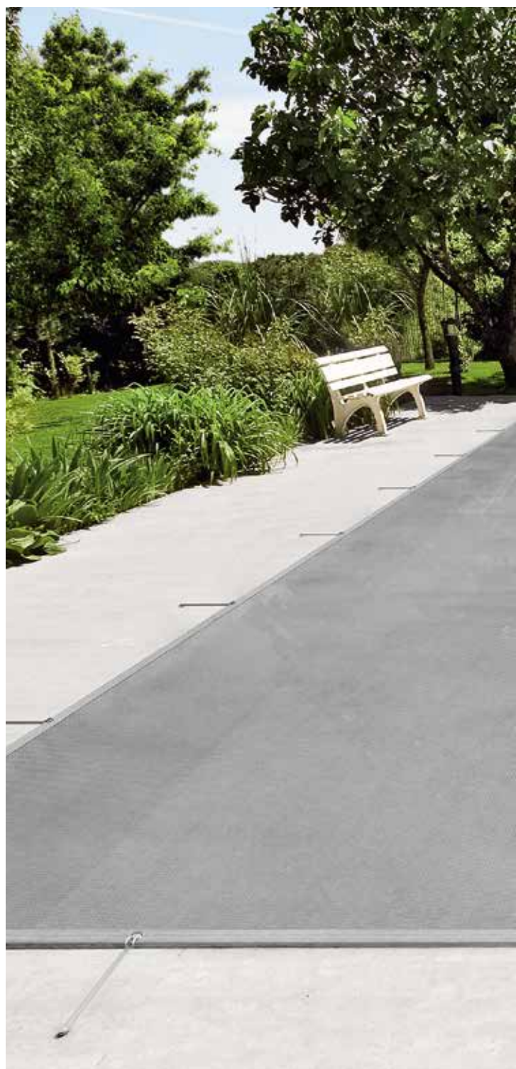
Herausgeberin: Bieri Gruppe, Schweiz Bild Umschlag: Bieri Schutznetz standard

Ihr Händler vor Ort: Votre distributeur: